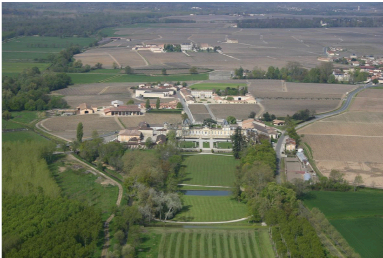
Sur le plateau viticole, des très belles propriétés se dévoilent.

Sur les appellations de Margaux, Moulis et Saint-Estèphe, les syndicats viticoles ont créé des Maisons du vin. Leur mission est de faire la promotion de toutes les propriétés adhérentes et de vendre des bouteilles au prix du château dans la boutique locale. Des dégustations sont organisées. Sur place, tous les renseignements sur la production, l'histoire du terroir et son actualité sont disponibles. C'est aussi le bon endroit pour obtenir une visite dans une propriété ouverte à l'année.