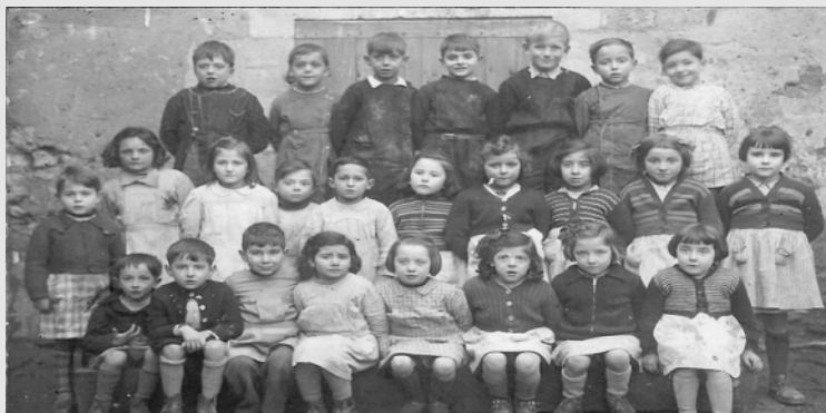
Classe de CP 1952